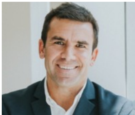
PRESIDENTE Ignacio Del WTC Montevideo Free Zone

DESEM Junior Achievement cuenta con un directorio integrado por representantes de destacadas empresas que a través de su experiencia, conocimiento y compromiso impulsan el mayor potencial de la fundación.